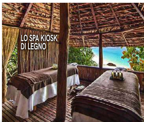
LO SPA KIOSK DI LEGNO

I prezzi: a dicembre, pacchetto Turisanda volo + trasferimenti collettivi + soggiorno 7 notti all inclusive da 3.703 euro a persona. Info: www.constancehotels.com