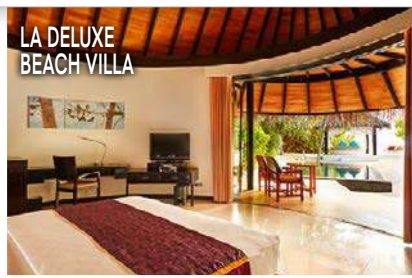
LA DELUXE BEACH VILLA

I prezzi: 7 notti con prima colazione nella Deluxe Beach Villa per 2 adulti e un bambino (fino a 15 anni sono gratuiti) 4.780 euro, volo escluso. Info: www.sunsiyam.com