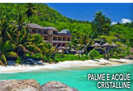
PALME E ACQUE CRISTALLINE