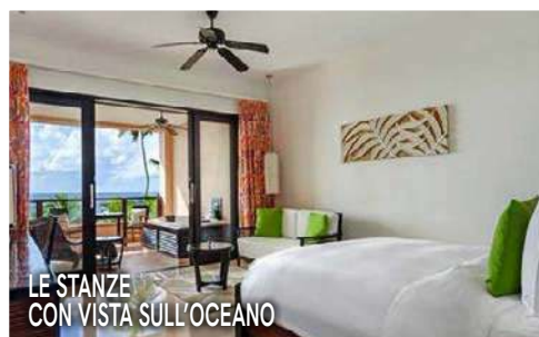
LE STANZE CON VISTA SULL'OCEANO

La meta: un eco-friendly resort a sud dell'isola di Mahé affacciato su Anse Forbans, fra le spiagge più belle dell'isola, con sabbia bianca e palme tropicali.