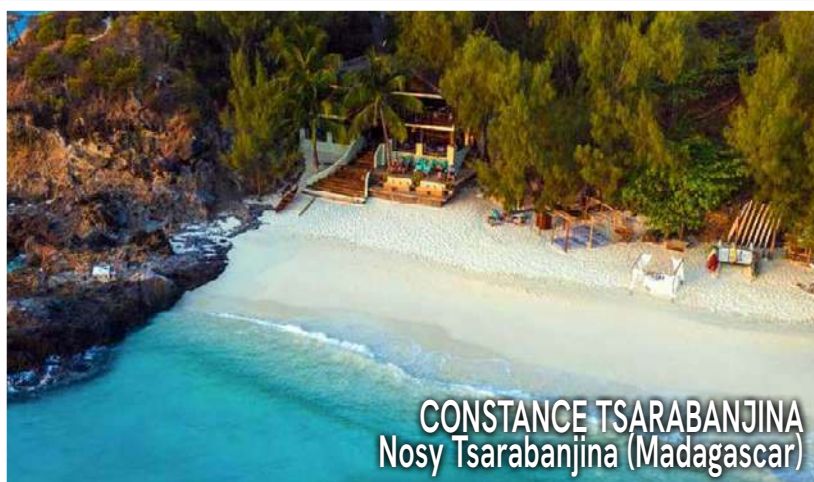
CONSTANCE TSARABANJINA Nosy Tsarabanjina (Madagascar)

La meta: l'isola di Nosy Tsarabanjina, nell'arcipelago di Mitsio, a 40 minuti di barca veloce da Nosy Be.