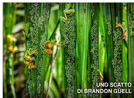
UNO SCATTO DI BRANDON GÜELL