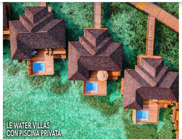
LE WATER VILLAS CON PISCINA PRIVATA