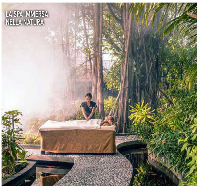
LA SPA IMMERSA NELLA NATURA

La meta: un 5 stelle del gruppo alberghiero 100% maldiviano Sun Siyam Resort sull'atollo di Noonu, situato a 45 minuti di volo panoramico da Malé, la capitale maldiviana, raggiungibile dall'Italia con volo diretto Neos ( www.neosair.it ).