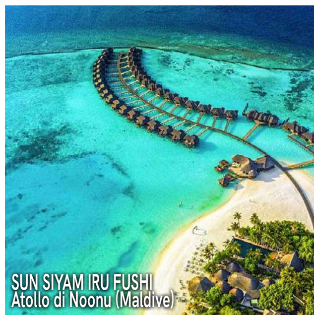
SUN SIYAM IRU FUSHI Atollo di Noonu (Maldive)