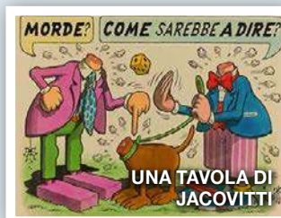
UNA TAVOLA DI JACOVITTI