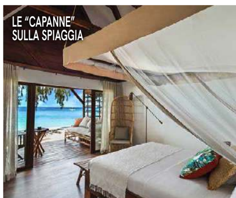
LE "CAPANNE" SULLA SPIAGGIA