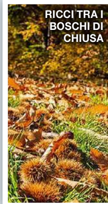
RICCI TRA I BOSCHI DI CHIUSA