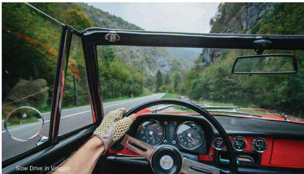
Slow Drive in Viaggio

La proprietà intellettuale è riconducibile alla fonte specificata in testa alla pagina. Il ritaglio stampa è da intendersi per uso privato