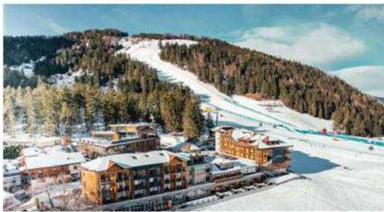
Excelsior Dolomites Life Resort

UNA SELEZIONE DI IDEE MOLTO ORIGINALI CHE, UNA VOLTA TESTATE, DANNO UNA CERTA DIPENDENZA: TORNARE ALLE VECCHIE ABITUDINI SARÀ UN'IMPRESA