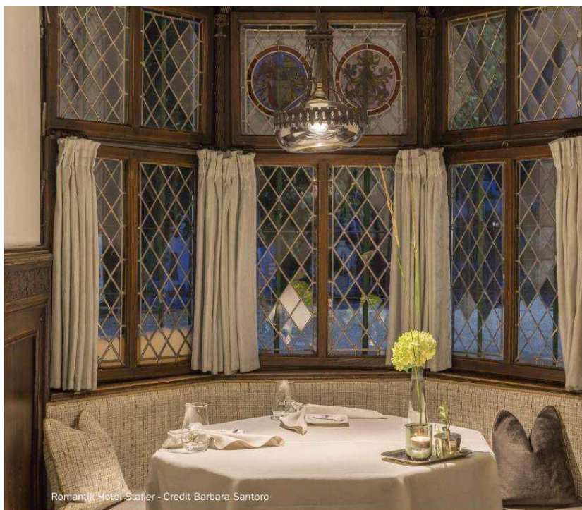
Romantik Hotel Stafler

Sciare in alta stagione può diventare un vero incubo di transfer, code, noleggi attrezzature. Almeno una volta nella vita (ma poi sarà per sempre), il consiglio è provare l' Excelsior Dolomites Life Resort di San Viglio di Marebbe (BZ), strepitoso hotel in cui si esce dalla porta