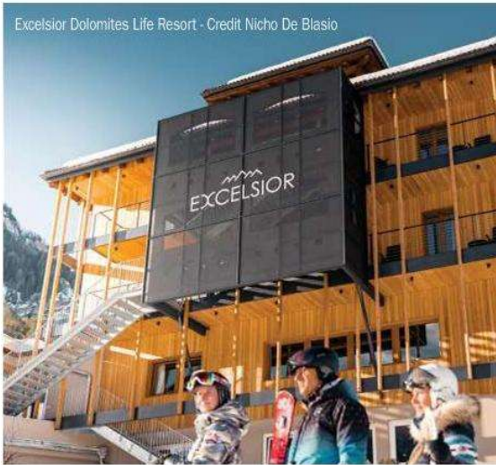
Excelsior Dolomites Life Resort

UNA SELEZIONE DI IDEE MOLTO ORIGINALI CHE, UNA VOLTA TESTATE, DANNO UNA CERTA DIPENDENZA: TORNARE ALLE VECCHIE ABITUDINI SARÀ UN'IMPRESA