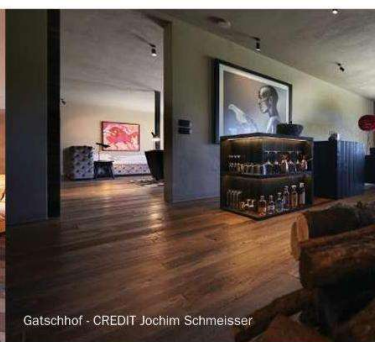
Gatschhof - CREDIT Jochim Schmeisser